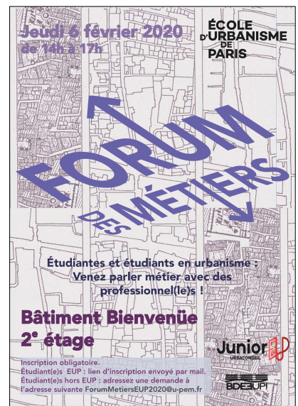
Affiches du Forum des Métiers, éditions 2018, 2019, 2020, 2021. © EUP/BDE/Junior EUP.