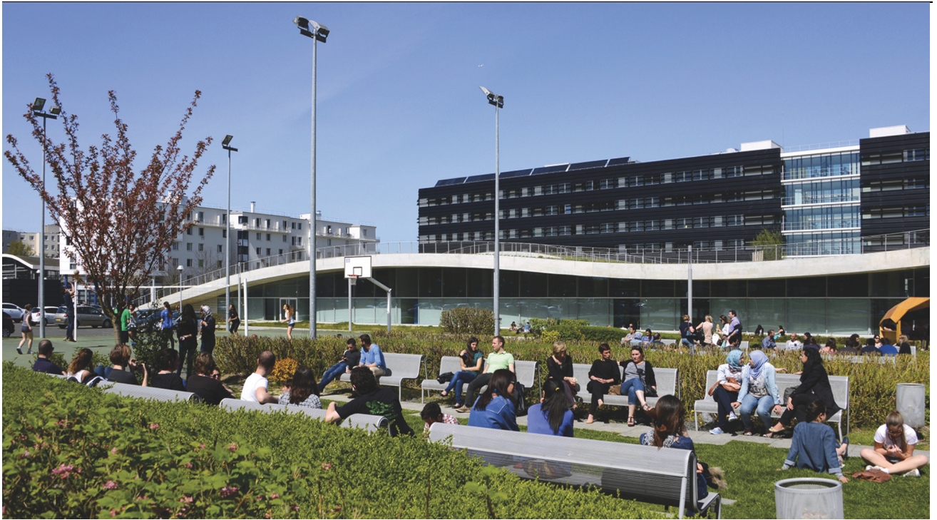
Cité Descartes, Bâtiment Bienvenüe. Architecte Jean-Philippe Pargade.