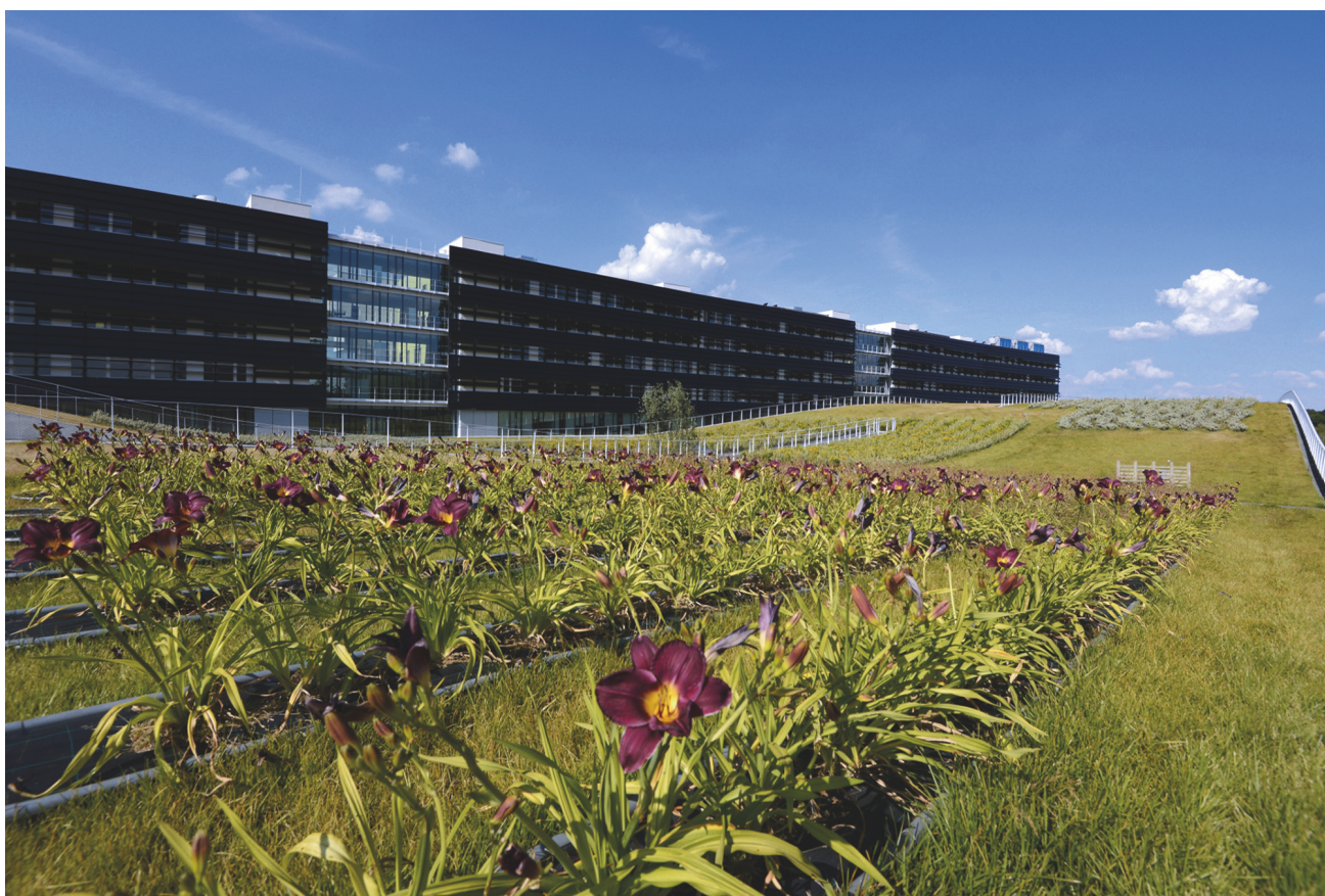
Cité Descartes.

Noura BADAoui ( noura.badaoui@u-pec.fr )