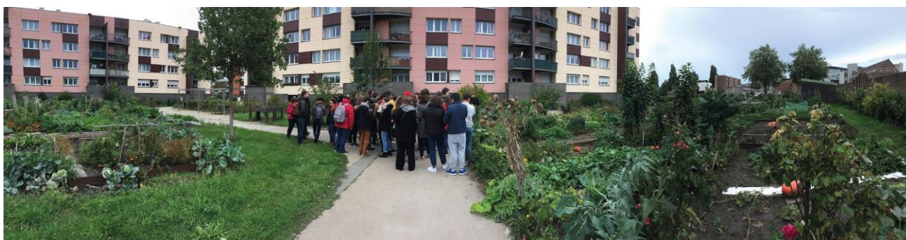
Voyage d'intégration de Master 1, 2019 © École d'Urbanisme de Paris.

Chaque année, l'EUP accueille près de 400 étudiant-es de niveau Master. Elle contribue autant au débat public qu'à l'animation des milieux professionnels par ses conférences, ses expositions et ses événements ouverts sur la société.