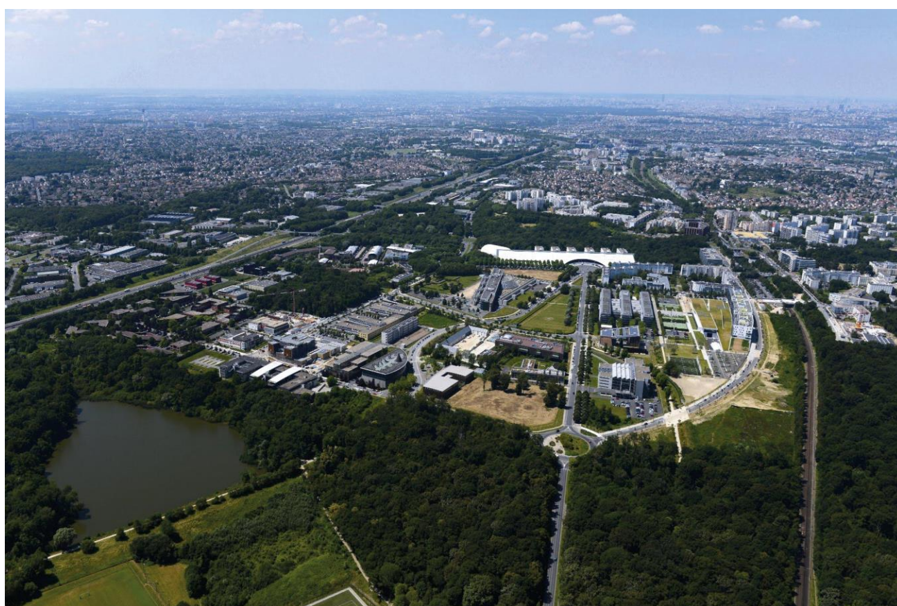
Cité Descartes.

Il est possible de suivre quelques modules dans le cadre d'une formation courte et non diplômante. Pour toute demande, nous contacter.