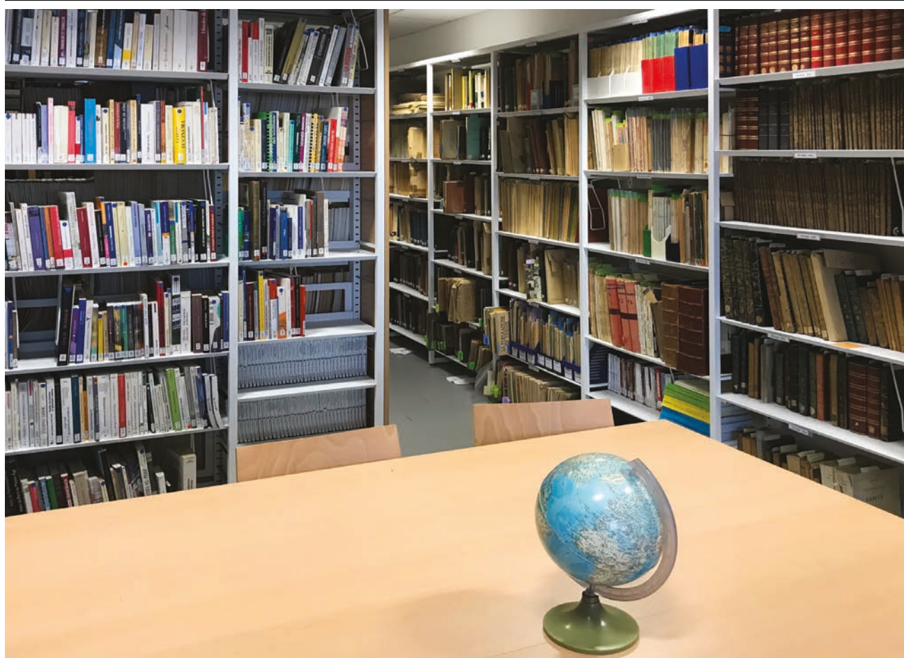
Bibliothèque Historique Poète et Sellier, École d'Urbanisme de Paris, décembre 2017.

→ https://www.institutparisregion.fr/mediatheque-francoise-choay.html