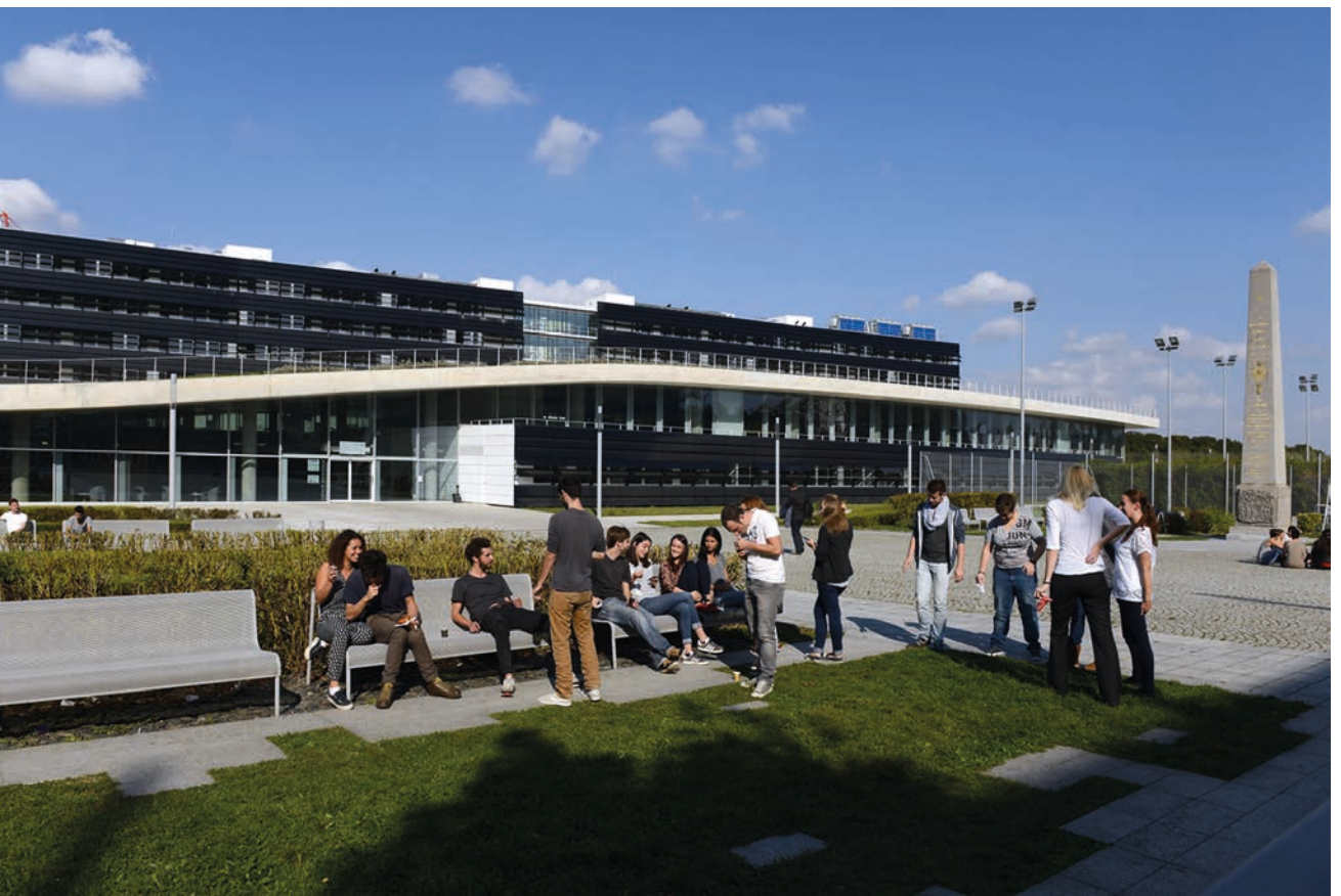
Cité Descartes. Bâtiment Bienvenue : architecte Jean-Philippe Pargade. Photos Éric Morency © Epamarne.