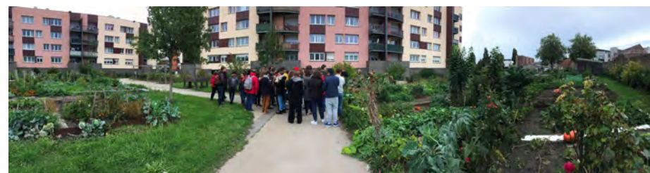
Voyage d'intégration de Master 1, 2019 © École d'Urbanisme de Paris.

Chaque année, l'EUP accueille près de 400 étudiant·es de niveau Master. Elle contribue autant au débat public qu'à l'animation des milieux professionnels par ses conférences, ses expositions et ses événements ouverts sur la société.