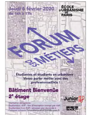
Affiches du Forum des Métiers, éditions 2018, 2019, 2020, 2021. © EUP/BDE/Junior EUP.