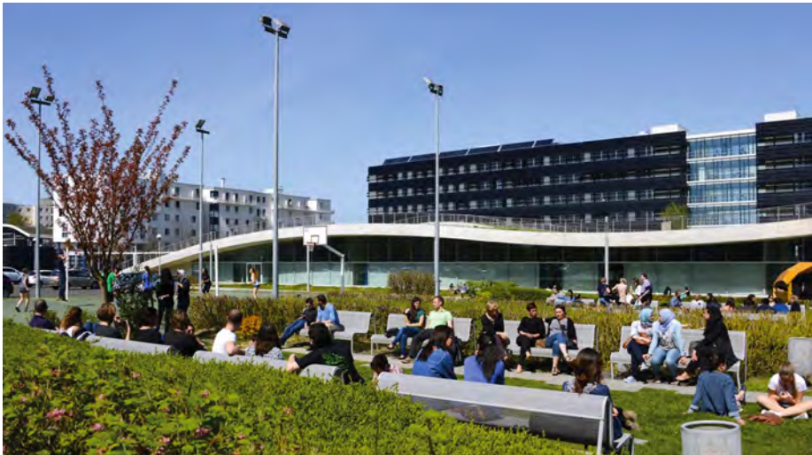
Cité Descartes, Bâtiment Bienvenüe. Architecte Jean-Philippe Pargade.