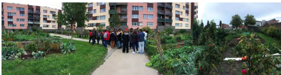
Voyage d'intégration de Master 1, 2019 © École d'Urbanisme de Paris.

Chaque année, l'EUP accueille près de 400 étudiant·es de niveau Master. Elle contribue autant au débat public qu'à l'animation des milieux professionnels par ses conférences, ses expositions et ses événements ouverts sur la société.