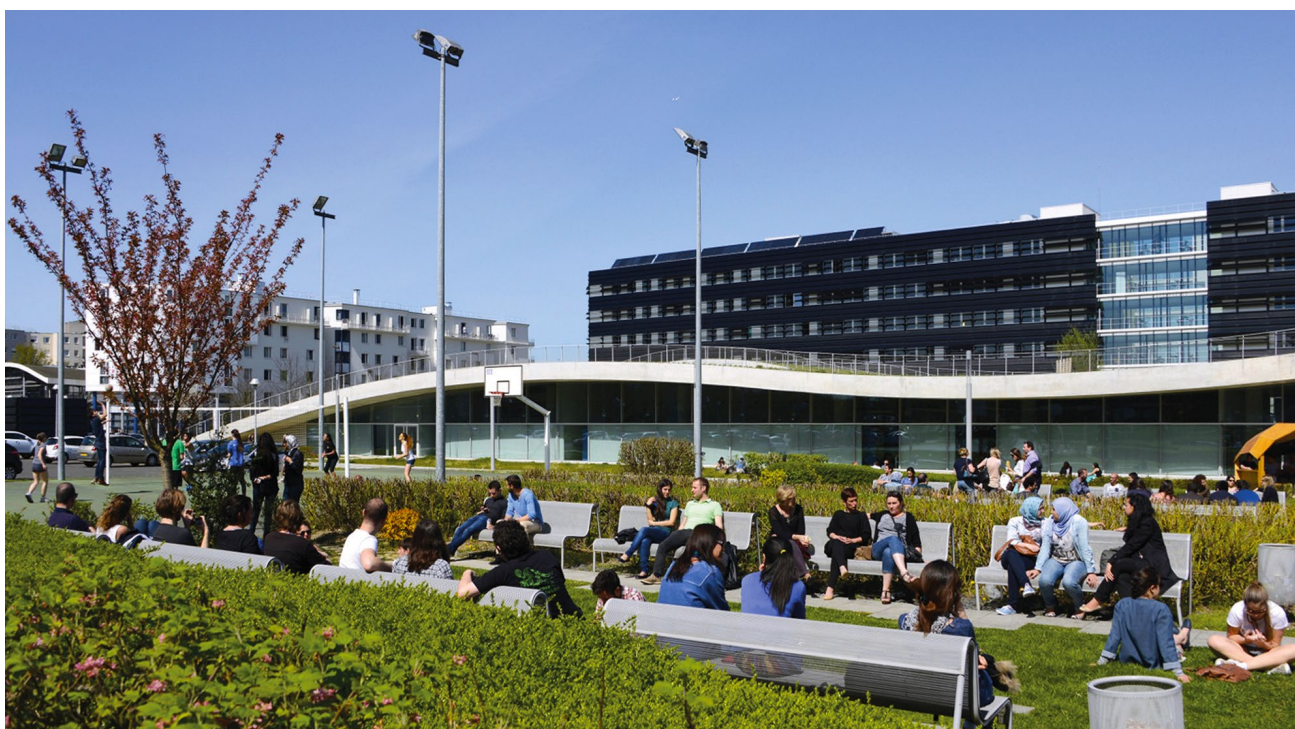
Cité Descartes, Bâtiment Bienvenüe. Architecte Jean-Philippe Pargade. Photo Éric Morency © Epamarne.