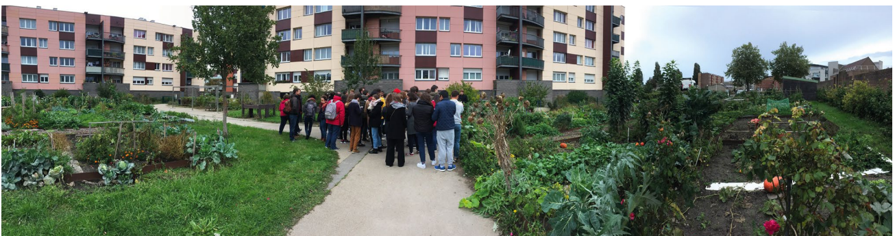
Voyage d'intégration de Master 1, 2019 © École d'Urbanisme de Paris.

Chaque année, l'EUP accueille près de 400 étudiant-es de niveau Master. Elle contribue autant au débat public qu'à l'animation des milieux professionnels par ses conférences, ses expositions et ses événements ouverts sur la société.