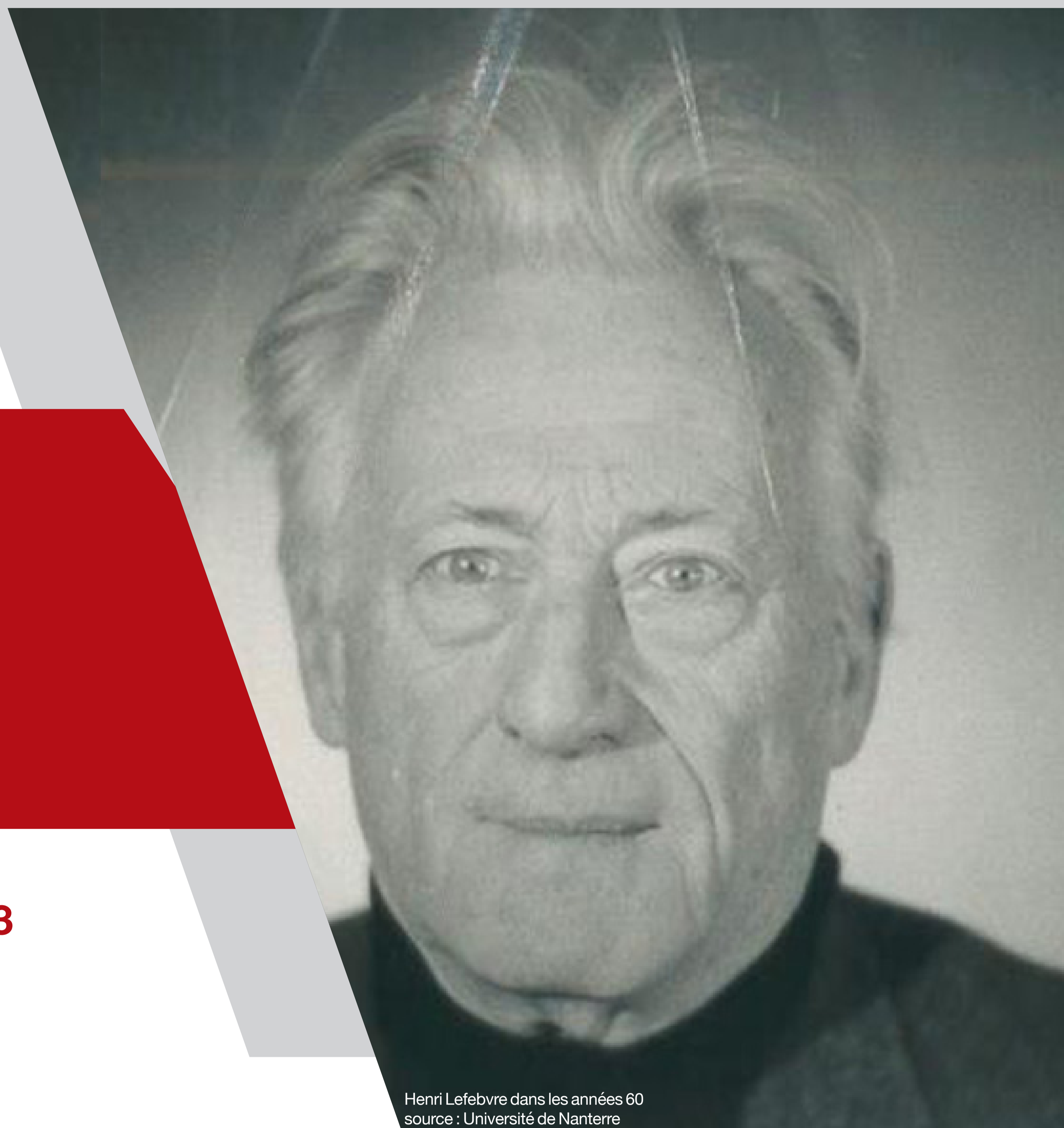
Henri Lefebvre dans les années 60

Né à Hagetmau dans les Landes, Henri Lefebvre s'inscrit à l'Université de Paris en 1919 dont il sort diplômé en philosophie. Il se considère dès cette période comme un philosophe-sociologue. Intellectuel marxiste, il adhère au parti communiste avant d'en être exclu en 1958 pour sa critique du stalinisme. Après un début de carrière dans l'enseignement secondaire, il entre en 1948 au Centre d'études sociologiques (CES) du Centre national de la recherche scientifique (CNRS). Il y développe des recherches en sociologie rurale dont une thèse de doctorat soutenue en 1954 avant de fonder en 1960 au sein du CES le Groupe de recherche sur la vie quotidienne. En 1962, son orientation se précise lorsqu'il participe à la fondation de l'Institut de sociologie urbaine. Entre temps il est devenu enseignant en étant nommé professeur à l'Université de Strasbourg en 1961 puis de rejoindre le campus de Nanterre de l'Université de Paris en 1965 où il vit en temps réel les événements de mai 1968 dont son plus célèbre ouvrage Le droit à la ville restera un emblème. Au-delà de son propre travail de recherche, Henri Lefebvre polarise une communauté de chercheurs en quête d'un renouvellement du marxisme.