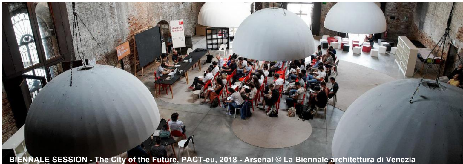
BIENNALE SESSION - The City of the Future, PACT-eu, 2018 - Arsenal